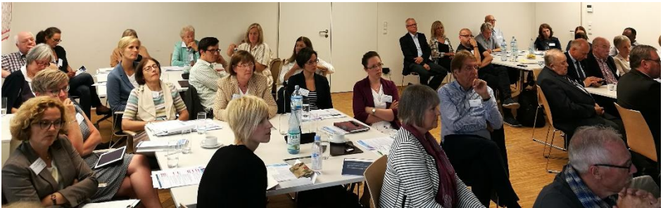
Fachtagung (Juni 2017)