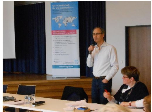
Workshop Alterssicherung (Dezember 2017)