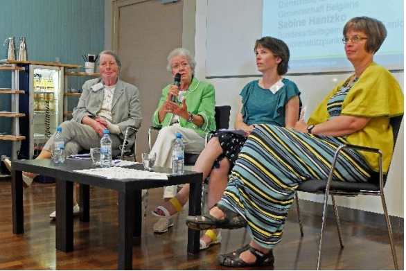
Workshop Selbstbestimmung und Autonomie (Deutscher Seniorentag 2018)